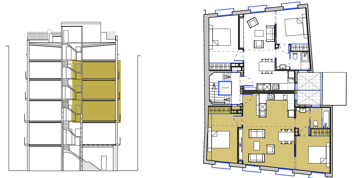
PLANTES PRIMERA, SEGONA I TERCERA

Els mobles representats als plànols no formen part de l'habitatge comercialitzat